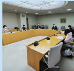
県内大学生の皆さんと 意見交換 （2月27日）