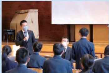
高崎高等特別支援学校 （令和4年12月19日）

群馬県議会では、若者の政治への関心を高めるための取り組みとして、高校生を対象に「 GACHI(ガチ)高校生 × (かける) 県議会議員 」を、大学生を対象に「 ぐんまシチズンシップ・アカデミー 」を実施しています。今年度もこうした事業を通して多くの学生・生徒と意見交換を行いました。未来を担う若者の柔軟な意見を県政に反映できるよう、今後も取り組んでまいります。