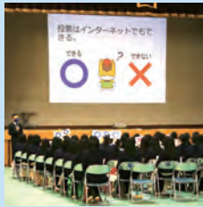
沼田女子高校 （1月26日）